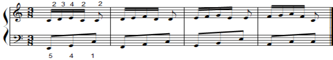
شكل رقم (١٦)

تمرين مقترح لتذليل صعوبة أداء نغمات أريجية مع نغمات متتابعة