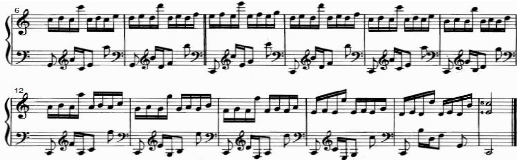
شكل رقم (١٢)

يوضح التدريب رقم (١٢) من الناحية النغمية والإيقاعية