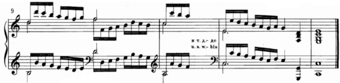
شكل رقم (٣٠)

يوضح التدريب من الناحية النغمية والإيقاعية