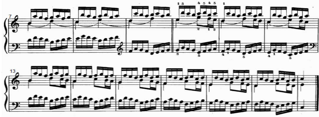
شكل رقم (٢٤)

التدريب التكنيكي رقم (١٩) من الناحية النغمية والإيقاعية