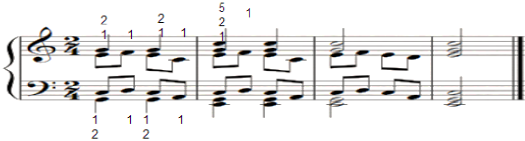
شكل رقم (٢٨)