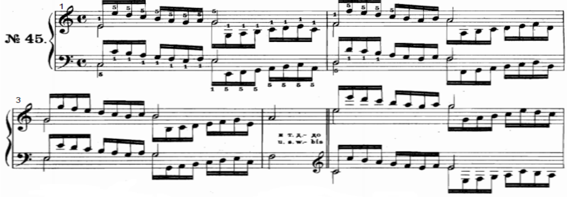
شكل رقم (٢٩)

- اليد اليسرى : أداء نفس نموذج اليد اليمنى ولكن يبدأ بالاصبع (٥) على أساس سلم دو الكبير .