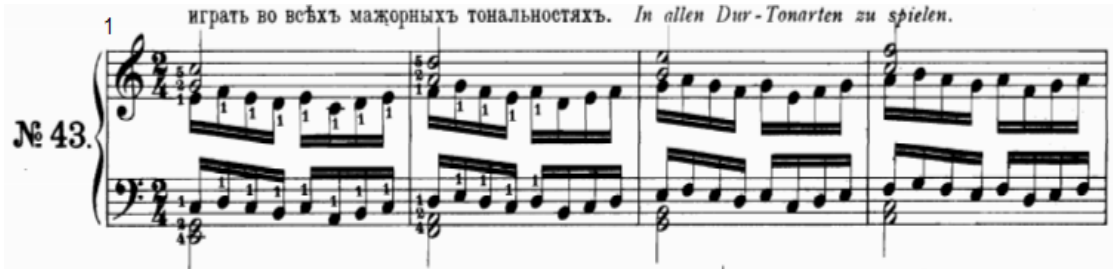
شكل رقم (٢٦)