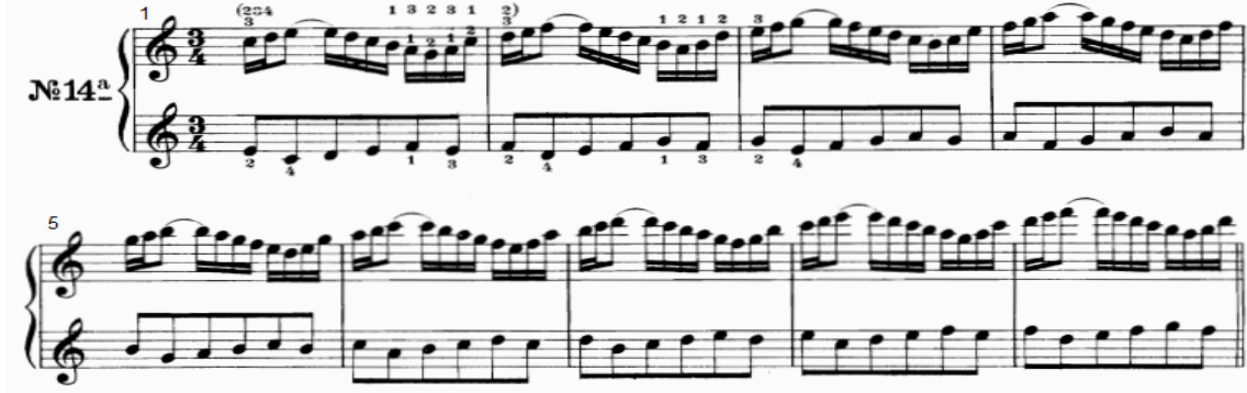
شكل رقم (١٧)

، ثم يتكرر هذا النموذج على درجات السلم حتى الوصول لدرجة جواب البداية في م (١٢) ثم يبدأ النموذج بالهبوط حتى الوصول لدرجة البداية والانتهاؤ بقفلة تامة في سلم دو الكبير . - اليد اليسرى : تؤدي نموذج قائم على مسافة الثالثة اللحنية الهابطة ، ثم تدرج سلمي صاعد ثم العودة لدرجة البداية ، يتكرر هذا النموذج صعوداً في تدرج سلمي حتى الوصول لدرجة جواب البداية في م (١٢) ويبدأ النموذج بالهبوط تدريجياً حتى نهاية التدريب في م (١٩) .