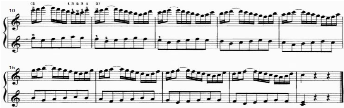
شكل رقم (١٨)

يوضح التدريب التكنيكي رقم (١٤) من الناحية النغمية والإيقاعية