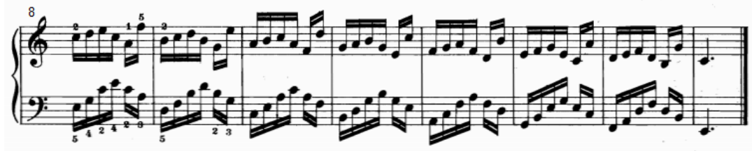
شكل رقم (١٥)

يوضح للتدريب التقني رقم (١٣) من الناحية النغمية والإيقاعية